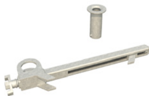
Stalowa klamra zaciskowa