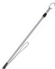
Hak służący do sięgania do odległych kotwic