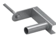
Zawias do furtki