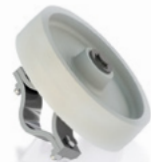
Koło do bramy