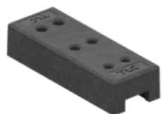
Stopa z tworzywa

Pełna gama akcesoriów dostępna na stronie internetowej oraz po kontakcie z doradcą techniczno-handlowym.