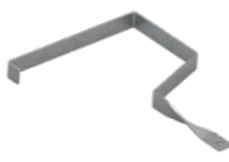
Obejma na stopę