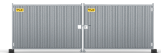
SMART Brama 5,7 z rygłem