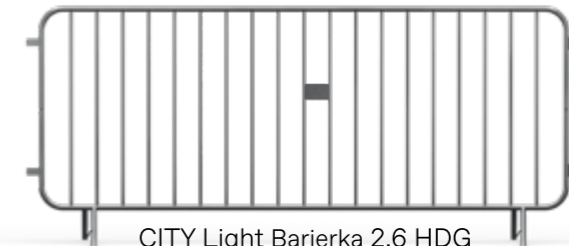
CITY Light Bariierka 2,6 HDG