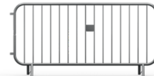
CITY Eco Standard Bariierka 2,3