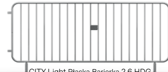
CITY Light Płaska Bariierka 2,6 HDG