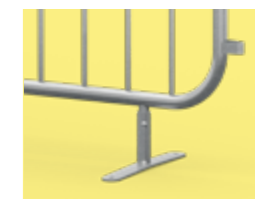
Wymienna stopa płaska