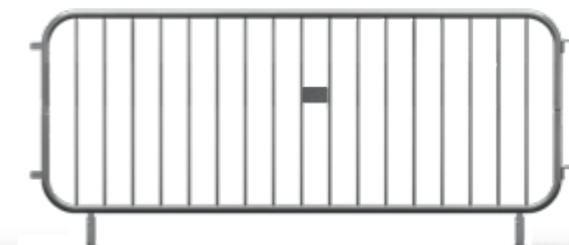
CITY Standard Płaska Bariierka 2,6 HDG