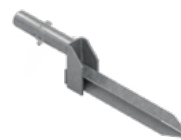
Uchwyt wbijany EPS-UW-V3 2,4 kg