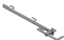
Uchwyt zaciskowy ze słupkiem EPS-UUS 7,2 kg