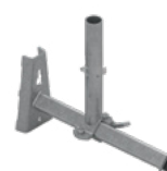
Uchwyt fasadowy EPS-USP 3,9 kg