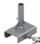
Uchwyt dźwigarowy EPS-UDZ-V2 3,4 kg