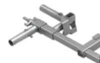
Uchwyt schodowy EPS-UUN-V4 7 kg