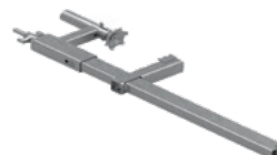
Uchwyt zaciskowy L800 EPS-UUN800-V2 8,5 kg