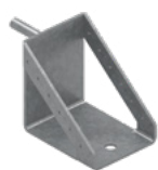
Uchwyt podestu roboczego EPS-UPR 1,8 kg