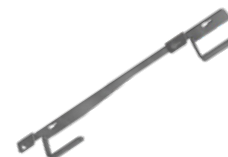
Podwójny uchwyt ścienny EPS-US2 1,7 kg