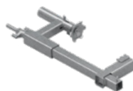
Uchwyt zaciskowy L500 EPS-UUN-V2 5,5 kg